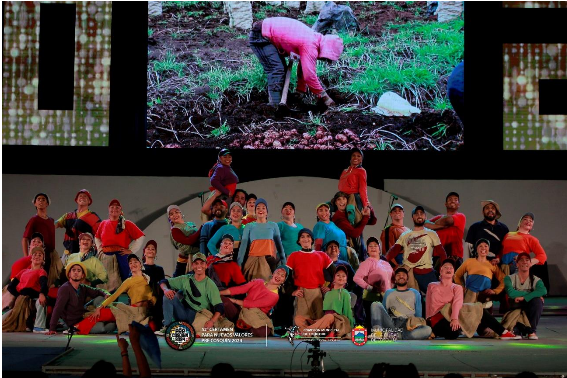
Imagen oficial de archivo

los que llegan a participar en el escenario Atahualpa Yupanqui se viene superando año tras año.