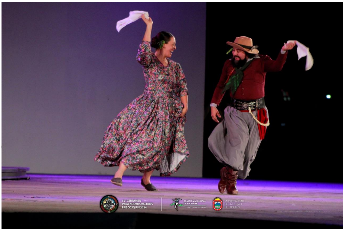
Imagen oficial de archivo