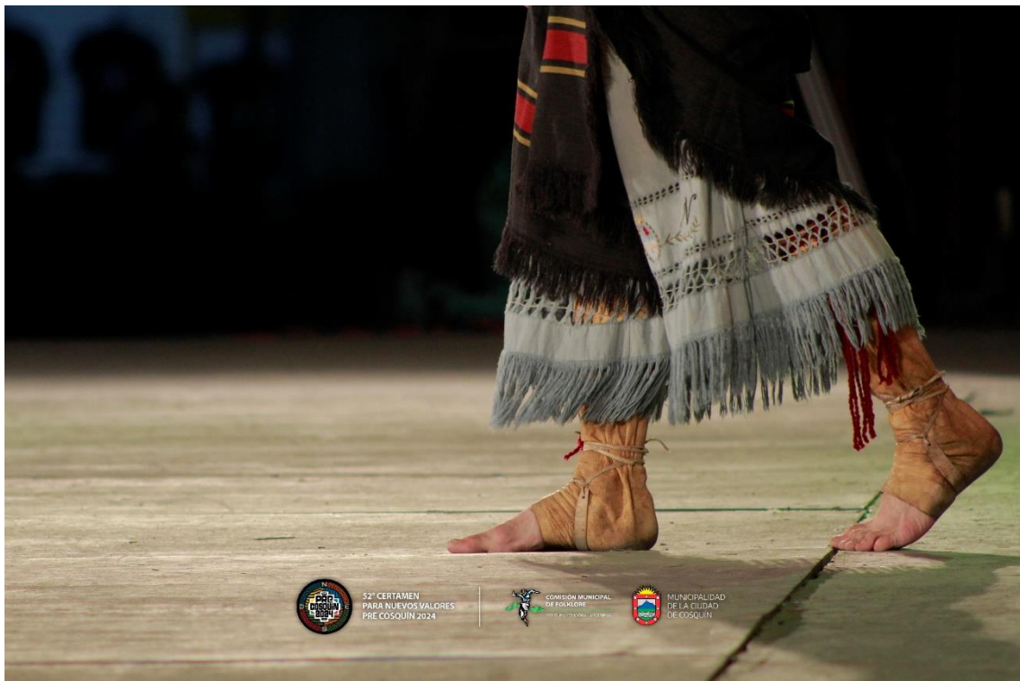
Imagen oficial de archivo